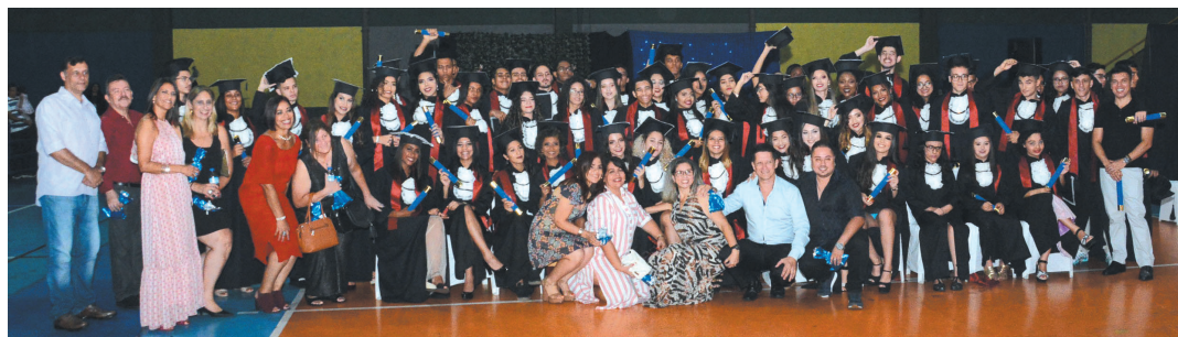
Escola Estadual Ary de Oliveira Garcia

O final do ano foi marcado por diversas formaturas. Veja algumas escolas no clique desta coluna