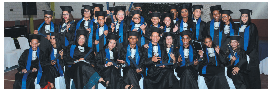
Escola Estadual Júlio Conceição