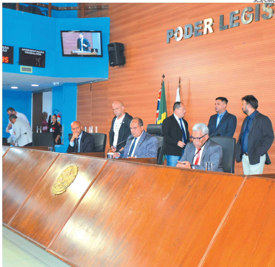
Sessão da Câmara que aprovou a criação da Guarda Municipal foi em 27 de dezembro