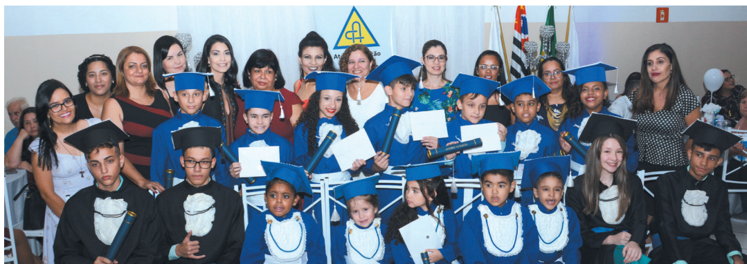
Escola Ateneu Cubatão, em 13 de dezembro, no Bufet Khallil