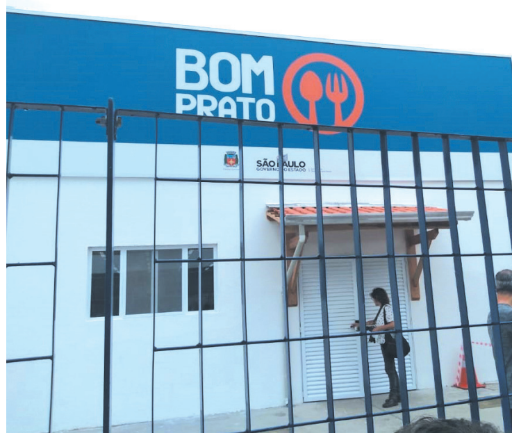
O Bom Prato foi inaugurado em 18 de dezembro

ser entregue, Zumbi disse que a empresa que estava a frente da obra, calculou errado o prazo de entrega, que acabou sendo maior do que o esperado. "Além desse espaço de tempo mal calculado para a entrega da obra, temos que levar em consideração que o imóvel onde está instalado o bom prato hoje, é um prédio antigo, com mais de 40 anos, o que exigiu uma maior atenção para a adaptação do próprio público", finalizou Zumbi.