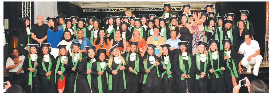
Formatura do Cien, dia 29 de novembro, no Bloco Cultural