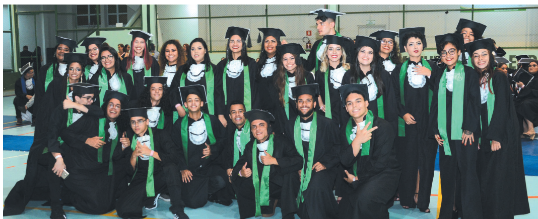
Curso de Meio Ambiente da Etec, no Centro Esportivo Pita