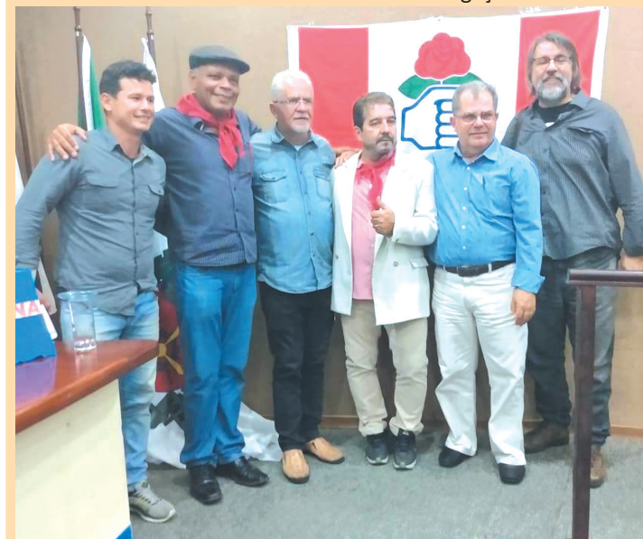
Membros do PDT durante o evento