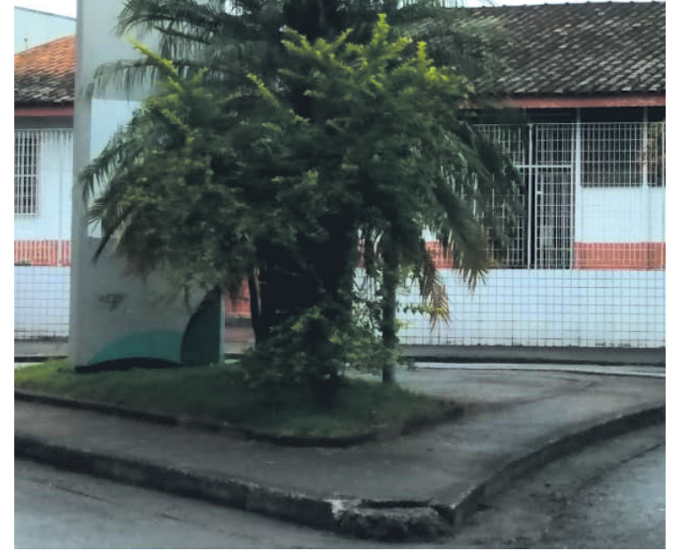
Escola Padre Antônio Olivieri teve falta de merenda

A Administração Municipal garante que, embora tenham sido identificados problemas, todas as crianças atendidas pela rede pública de ensino estavam e estão sendo alimentadas no turno escolar. E de acordo com a Secretaria de Educação, as escolas têm aulas normais; nenhuma classe foi ou será dispensada na rede por este motivo.