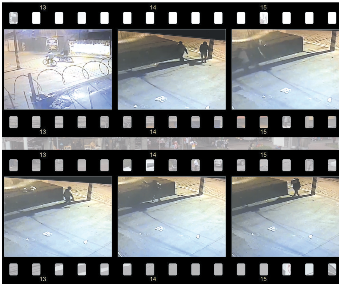
Flagrante de um furto feito por uma câmera de segurança de comércio

Na última edição da Folha, o jornal publicou que em agosto, ladrões entraram na galeria Wagner Tenório, que já havia sido invadida no primeiro semestre desse ano. Outro centro comercial