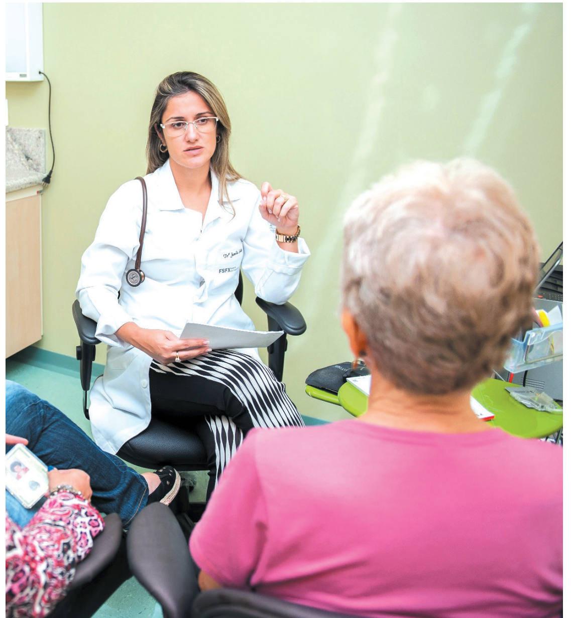
Nota máxima obtida no IDSS, colocou a Usisaúde como uma das 4 melhores do país

A Resolução Normativa 277 é um programa criado pela ANS em 2011, para certificar as melhores operadoras de saúde do país. O objetivo é aumentar a qualidade da prestação dos serviços por meio de critérios de avaliação que possibilitam a identificação e solução de problemas por parte das operadoras de planos de saúde, com mais consistência, segurança e agilidade. Quanto mais eficiente for a operadora, mais notada ela será na qualidade dos serviços prestados. A RN 277 incentiva também a busca pela eficiência e oferece informações capazes de dar ao consumidor maior percepção em relação à qualidade de uma operadora.