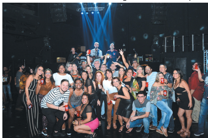
Um sucesso o 2º Encontro dos amigos do Cortavino, muita gente bonita, comes bebes e boa música. Parabéns a organização!