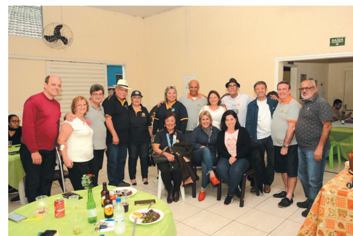
O Rotary Club de Cubatão promoveu a já tradicional Feijoadada do Rotary, uma delícia os companheiros tiveram uma tarde maravilhosa. Sucesso!