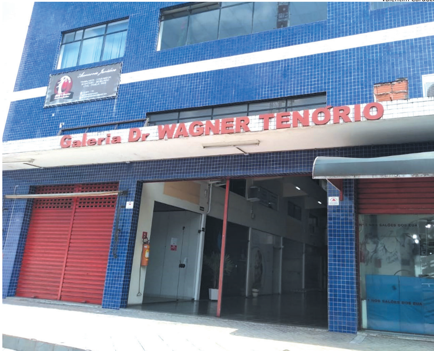
Galeria Wagner Tenório foi alvo dos criminosos