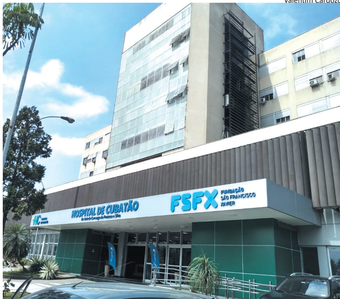
Funcionamento do Hospital está tendo diversos problemas

FSFX - Em nota a Fundação São Francisco Xavier (FSFX) esclarece que preza pela qualidade e segurança